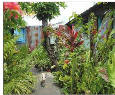
Michel Reynaud accorde beaucoup d'importance à la végétation, à l'image de ce qui se faisait dans les cases lontan.