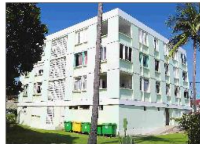
Cet ancien immeuble de Ravine-Blanche illustre bien la « culture du bunker » que dénonce l'architecte.